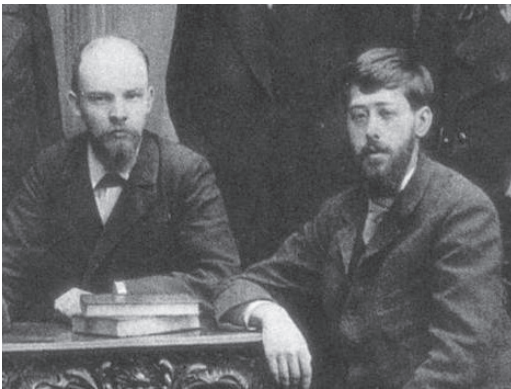
Lenin y Martov

Polemizó con los análisis y la política agraria de los populistas: A propósito del llamado "problema de los mercados" (1893), ¿Quiénes son los "amigos del pueblo" y cómo luchan contra los socialdemócratas? (1894) y El desarrollo del capitalismo en Rusia (1899). También enfrentó al llamado "Marxismo legal" de Piotr Struve y M. I. Tugan-Baranowsky, tendencia que pasó rápida y abiertamente al campo burgués. En el exilio fue el principal impulsor de Iskra y enfrentó políticamente a los "economicistas" de Rabóchaia Misl [El Pensamiento Obrero], Rabócheie Dielo [La Causa Obrera] y "El Credo" (versiones rusas del revisionismo).